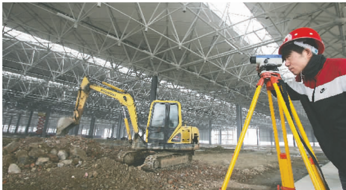
一汽-大众三期项目开工建设现场

今年以来,成都先进制造业方面捷报频传,汽车、电子信息、新材料、生物医药等产业全面开花,全市工业呈现出“速度领先、总量提升、质量改善、运行平稳”的态势,新型工业化进程进一步加快,成都的“产业倍增”战略迈出了坚实的一步。