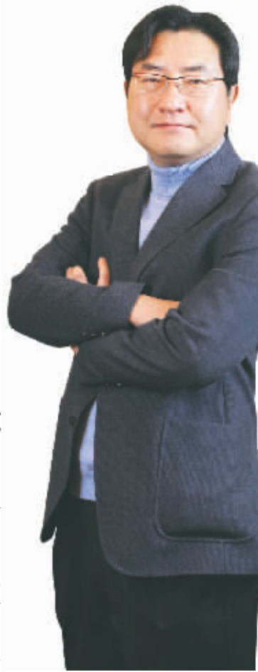
亚洲鼻整形最具影响力医师、西婵整形美容医院鼻整形学科带头人、韩国整形医师协会会长 赵晟弼教授