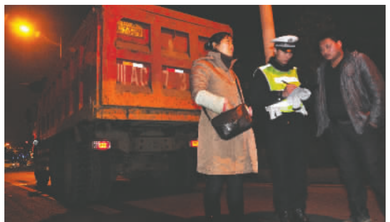
昨晚,交警在货运大道发现货车闯红灯

随后交警还发现,这辆车同时存在违规加装前大灯、等违法违规行,其货厢规格也不符合成都市对建筑渣土运输车辆的