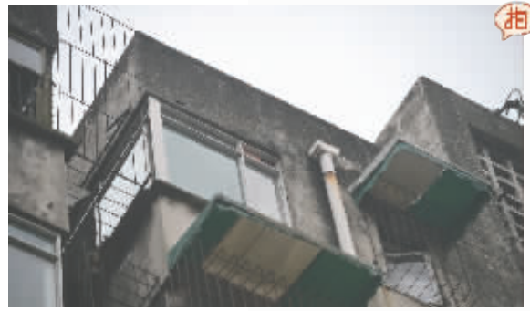
彭州天彭镇龙兴南街,这扇紧闭的窗户夺走了4个年轻人的生命

楼下邻居 前天深夜12点过，上厕所时听见楼上有洗澡的声音，早晨起来发现自家厕所大面积渗水 另一房间 曾经听到房外传来呕吐声，但考虑到外面人多可以互相照顾，也没有起床询问究竟