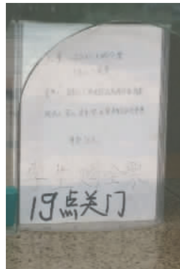
7月30日,成都动物园当日起凭学生证等证件进园半价。之前,记者曾在动物园售票处窗口看到“学生购全票”“学生证无用”等提示,与国家发改委的相关规定不符。