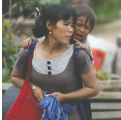
8月4日，云南昭通鲁甸地震灾区，受灾群众背着孩子撤离。