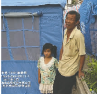
8月4日，云南昭通鲁甸地震灾区，一位小女孩站在救灾帐篷前。