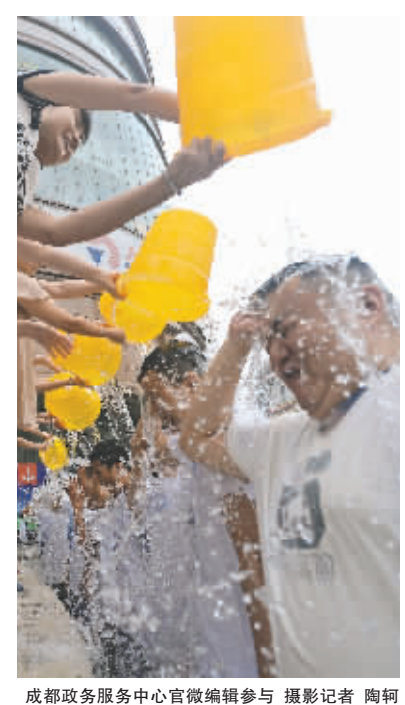
成都政务服务中心官微编辑参与

成都商报发起“暖冰行动”,延缓渐冻人被冰冻的脚步。呼吁广大成都人行动起来,挑战冰桶,关爱罕见病群体