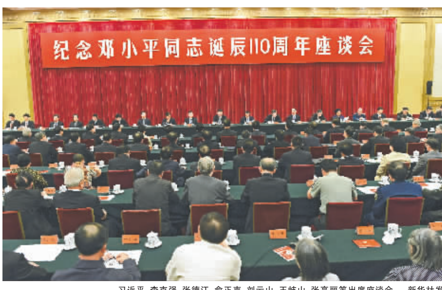
习近平、李克强、张德江、俞正声、刘云山、王岐山、张高丽等出席座谈会