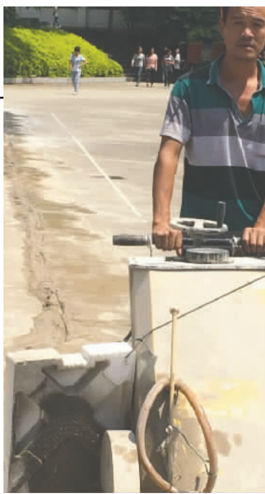
巧家县一中,工作人员已开工修建足球场

元。”成都万裕实业负责该项目的一工作人员介绍,“捐建足球场只是万裕实业支持巧家教育发展的第一步,将来还将长期合作,对巧家一中品学兼优的学生进行资助,帮助他们完成学业。”