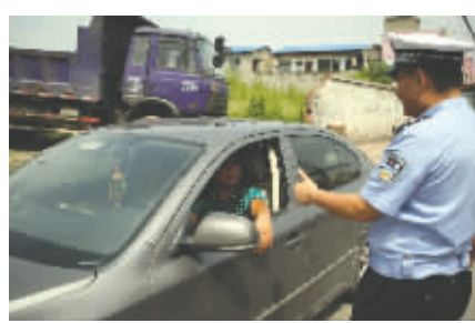
交警向司机伸出大拇指,赞扬避让校车行为