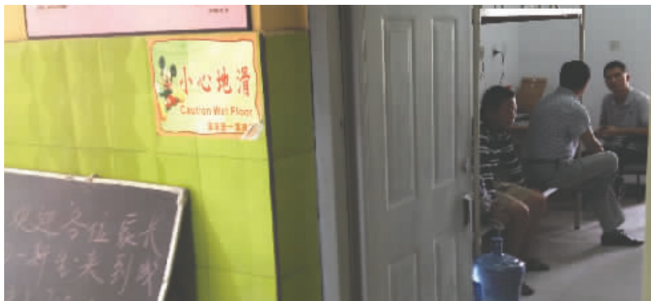
昨日,成都52中,“阳台男孩”和父亲来到学校咨询上学事宜