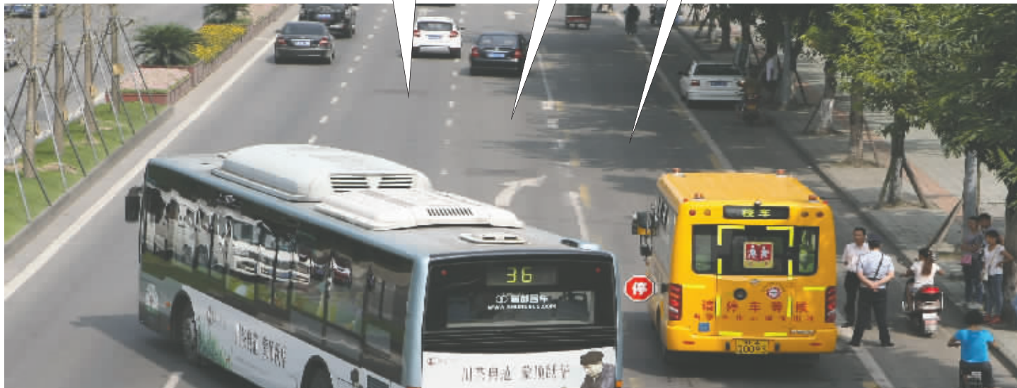
校车在西华大道华侨城站公交站靠道路右侧停靠。在4分钟测试时间里,约40辆汽车变道超车

同方向车道 校车停靠时,后方车辆应当停车等待,不得超越;不得鸣喇叭或者使用灯光催促校车