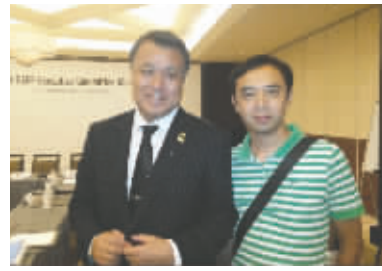
田岛幸三(左)与成都商报记者合影

昨日上午，东亚足联第43次执委会在成都举行，本次会议的主题是表决产生2015年东亚杯的举办城市。会后，东亚足联副主席、日本足协副主席兼秘书长田岛幸三接受了成都商报记者的采访。由于在前一天，日本的名古屋海洋队夺得2014五人制亚足联冠军杯，我们的话题也从五人制足球开始。