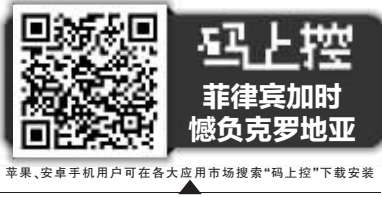
苹果、安卓手机用户可在各大应用市场搜索“马上控”下载安装