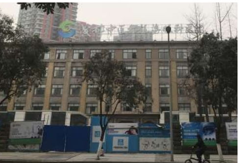
星辉西路8号的老建筑已变成医院