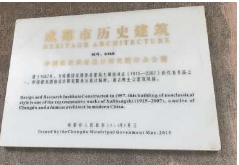
老建筑入口处的“成都市历史建筑”保护标志

办公楼从外观来看并无多大变化,不过楼顶上“成都中医大银海眼科医院”的招牌却很醒目。记者仔细观察,该办公楼整栋主体完整,墙面保持原样,曾经的字迹和图案也保留在外墙上。随后,记者进入该办公楼,在入口处看到“成都市历史建筑”字样的保护标志挂在墙上。而办公楼的走廊、房间内部等已重新装修,变成了医院所用的诊断室、观察室,部分病床等医用设备已到位。工人告诉记者,他们正在对办公楼内部进行装修。