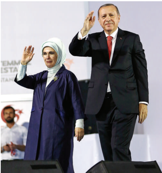
7月15日，在土耳其伊斯坦布尔，土总统埃尔多安(右)出席未遂军事政变一周年集会

7月15日是土耳其未遂军事政变一周年纪念日。深夜时分，首都安卡拉数万民众聚集在议会大厦前，或高举国旗，或手持遇难者遗像，纪念一年前那场震惊世界的未遂政变，悼念遇难者。 一年前的夏夜，少数军官发动军事政变，战机呼啸，坦克穿城，近250人在冲突中丧生。虽然政变在短短数小时内即被粉碎，但这次短命政变对土耳其内政外交格局产生了深远影响。