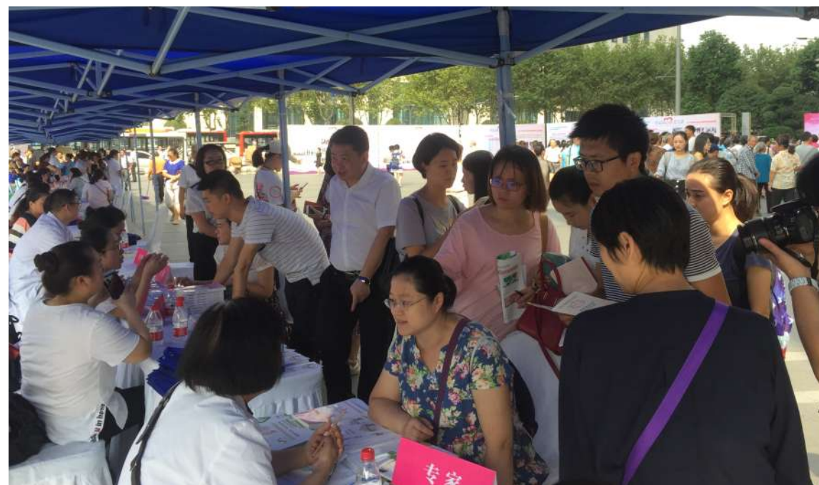
活动现场, 前来咨询的市民非常多

“我正在备孕, 需要注意点什么?” “宝宝生下来的时候左脚有点内翻, 不会有什么问题吧?” 9月12日是第13个中国预防出生缺陷日, 省、市、区三级联动在成都金牛区万达广场开展了以“全民同心, 让爱无缺”为主题的“中国预防出生缺陷日”主题宣传活动, 来自华西第二医院、成都市妇女儿童中心医院、四川省妇幼保健院、成都市第一人民医院、成都市第二人民医院、成都市第三人民医院、金牛区妇幼保健院等医院的多位专家也坐镇现场, 为前来咨询的市民讲解出生缺陷的防控知识。