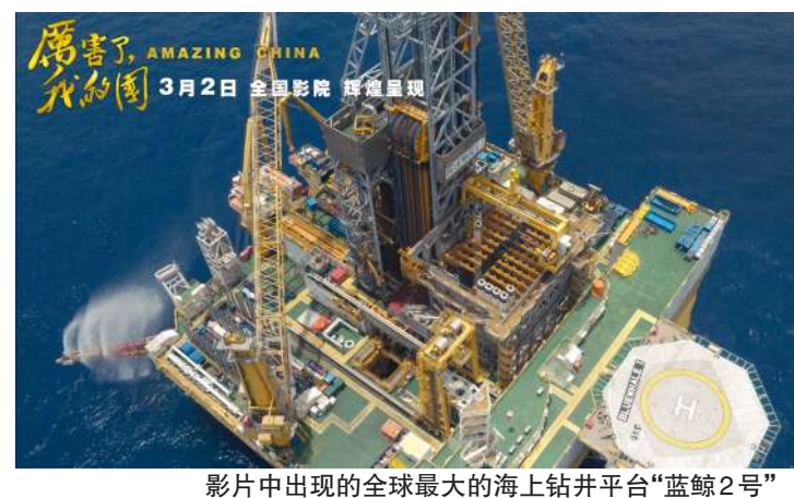
影片中出现的全球最大的海上钻井平台“蓝鲸2号”