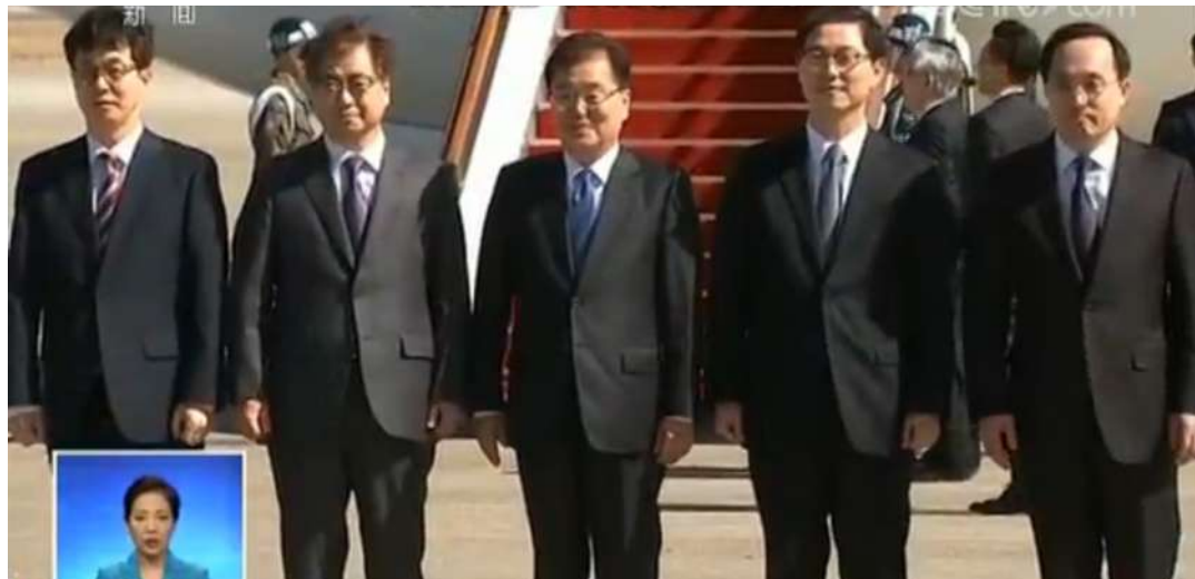
韩国特使团出发前往朝鲜