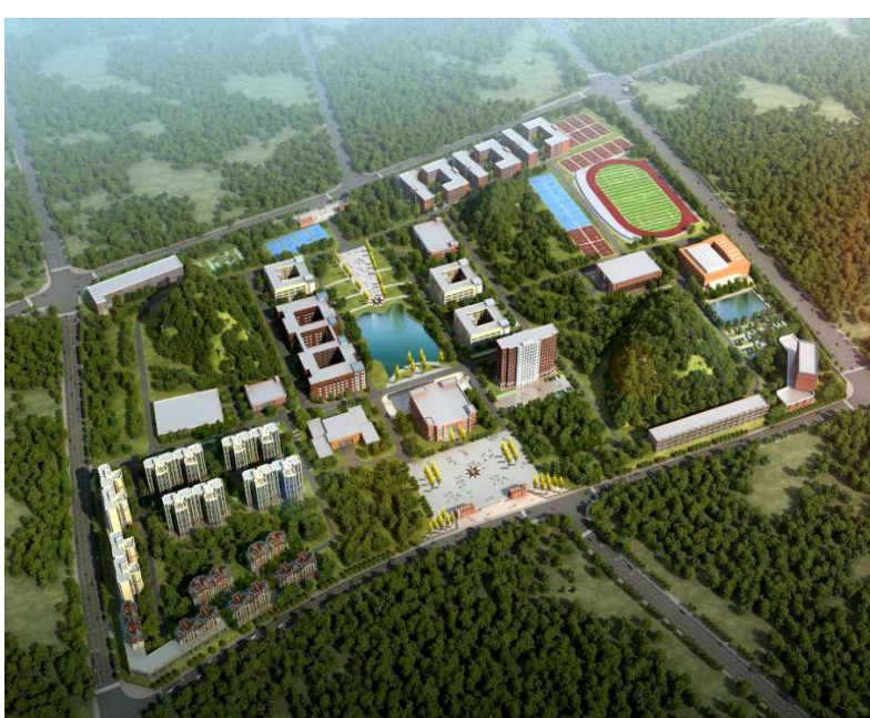
川内首所环保类高校落地资阳(效果图)

学院将依托先进的教育理念和雄厚的师资力量，将学生培养成为国家战略性新兴产业高端技能人才，将学院打造成为四川乃至西部环境产业重要的高端技能人才培养基地。