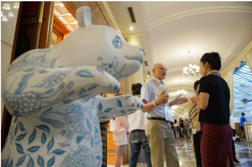
6月12日,出席第二届中国-中东欧国家艺术合作论坛的嘉宾正在交流