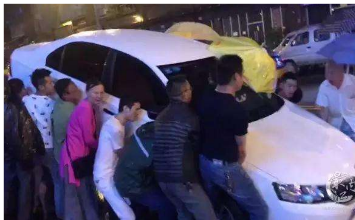
内江市民合力抬车救人

11日晚，内江城区五星路，一辆保时捷越野车与一辆三轮车相撞，致使三轮车上两人被撞进路旁一辆白色小轿车车底。尽管有不少群众积极抬车救人，但不幸的是，事故造成3人受伤，其中1人经抢救无效死亡。据内江市公安局交警支队通报，肇事后弃车逃逸的违法犯罪嫌疑人已在15小时后到案，目前已被刑事拘留。