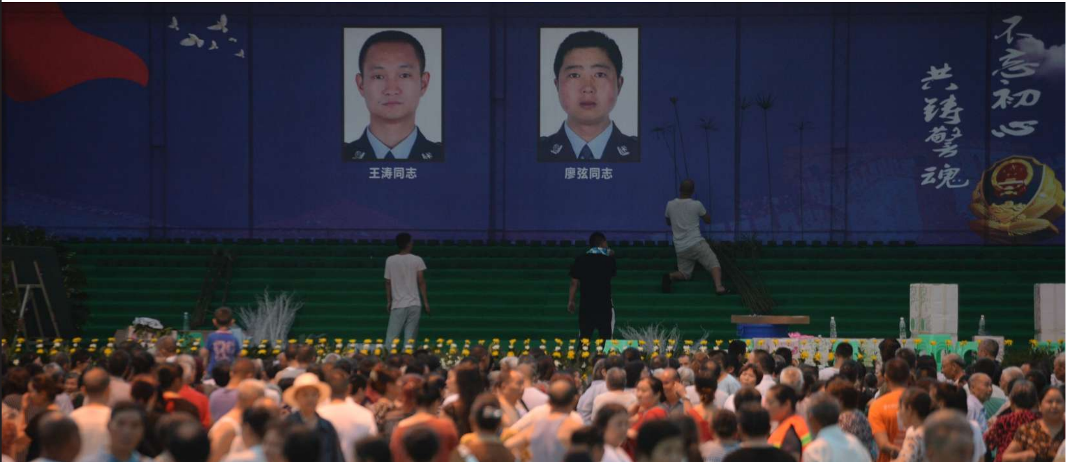
8月9日仁寿县法治广场，两位英雄遗体告别仪式布置现场