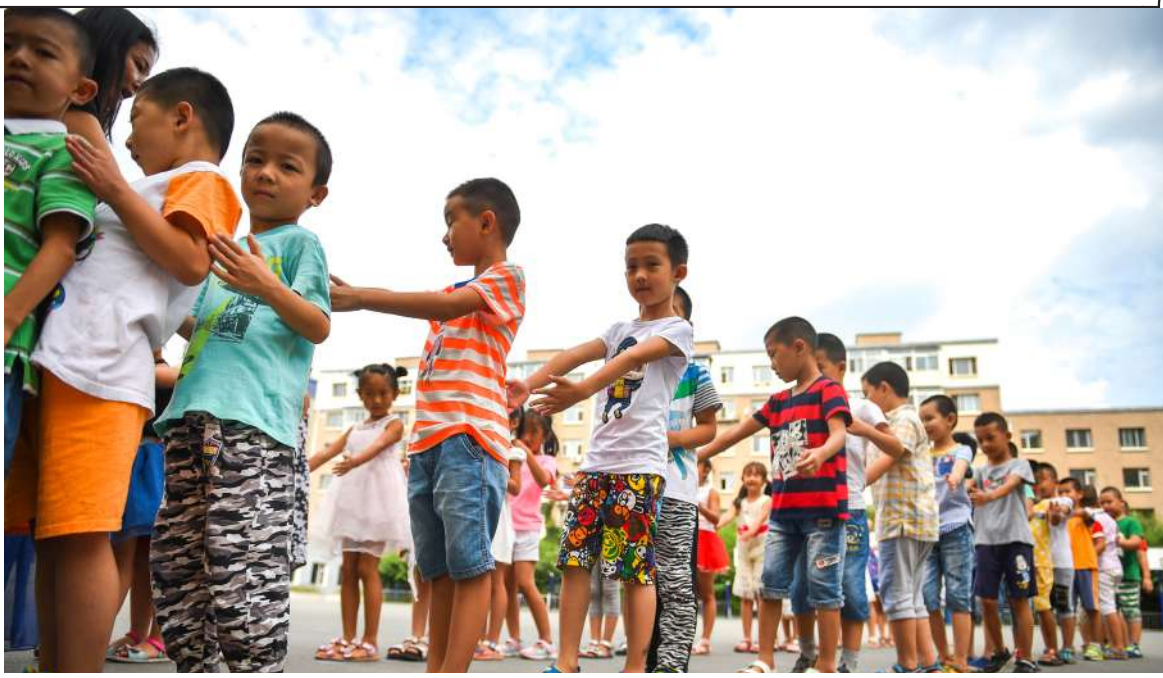
快乐才是孩子本来的样子

在幼儿园就要学拼音、珠算、英语……这是现代版的“拔苗助长”。不久前教育部发布通知，将开展幼儿园“小学化”专项治理工作。面对这一顽疾，不能头痛医头，而应系统施治。幼儿园里不教小学课程，幼小衔接也要填平“代沟”，小学更应坚持零起点教学。整个教育链条理顺了，才能有效纾解家长焦虑，让幼儿教育回归快乐。（新华社）