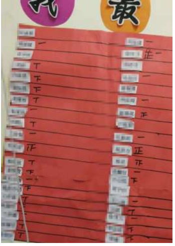
这是幼儿园班上搞的“计分表”

教育股相关工作人员介绍，今年，根据教育部下发的文件，雁江也将开展幼儿园小学化专项治理，目前正在制发文件，下一步对督查中发现的相关问题，将要求整改并根据情况处理。“幼儿家长发现幼儿园存在这些问题，也可向教育部门反映或举报，我们查实后都将进行处理。”