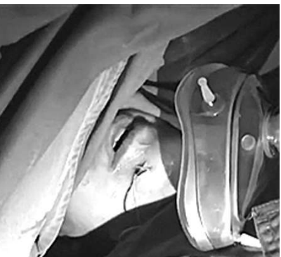
小王在手术中唱《遗失的美好》