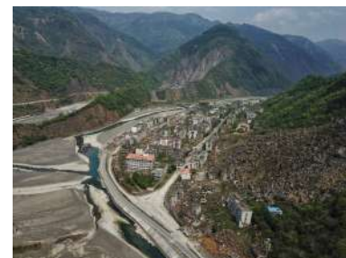
记者王效镜头下的北川地震遗址