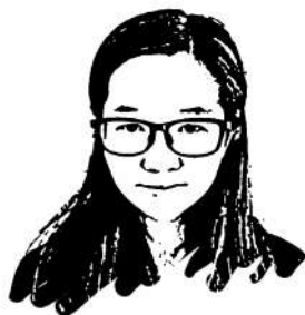
■成都商报-红星新闻记者 叶燕

作为一名新时代的时政记者,我时刻提醒自己,肩负时代担当,展现职业态度,写出更多有思想、有温度、有品质的新闻报道