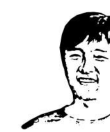
■成都商报-红星新闻记者 王春

每次,稍有不顺,我会安慰自己:记者是历史的见证者与记录者,甚至推动者。这是一种荣光,也是一种责任