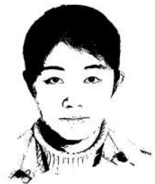
■成都商报-红星新闻记者 颜雪

每天走过成都的大街小巷,我更多时候是在跟这座城市中的草根小人物打交道,为这座城市中的喜怒哀乐、人情冷暖行走在路上