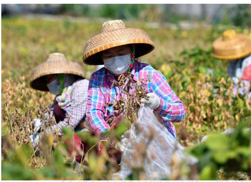
工人在采收中国农业科学院油料作物研究所在三亚繁育的大豆

2021年中央一号文件《中共中央 国务院关于全面推进乡村振兴加快农业农村现代化的意见》21日正式出台。这是21世纪以来第18个指导“三农”工作的中央一号文件，凸显了新发展阶段党中央对农业农村工作的高度重视。文件明确，到2025年，农业农村现代化取得重要进展，城乡基本公共服务均等化水平明显提高。在农业基础设施建设、粮食和重要农产品供应、农业质量效益和竞争力、农村生态环境等方面都将实现大幅度改善和提升，农民的获得感、幸福感、安全感明显提高。