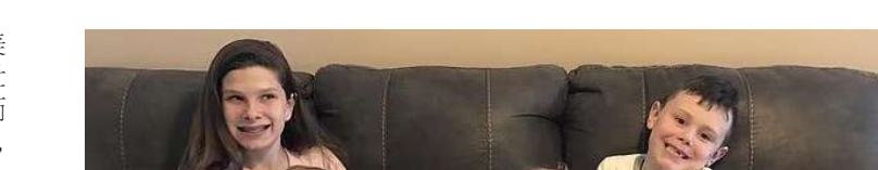
三胞胎(中)与姐姐和哥哥的合影

据外媒报道，一位怀三胞胎的美国母亲打破了三胞胎分娩时长的世界纪录，她用了5天生出了三个娃，此前的世界纪录是两天。不仅如此，三胞胎的生日甚至还“跨年”了。