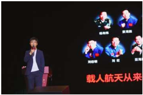
专家讲述航天知识