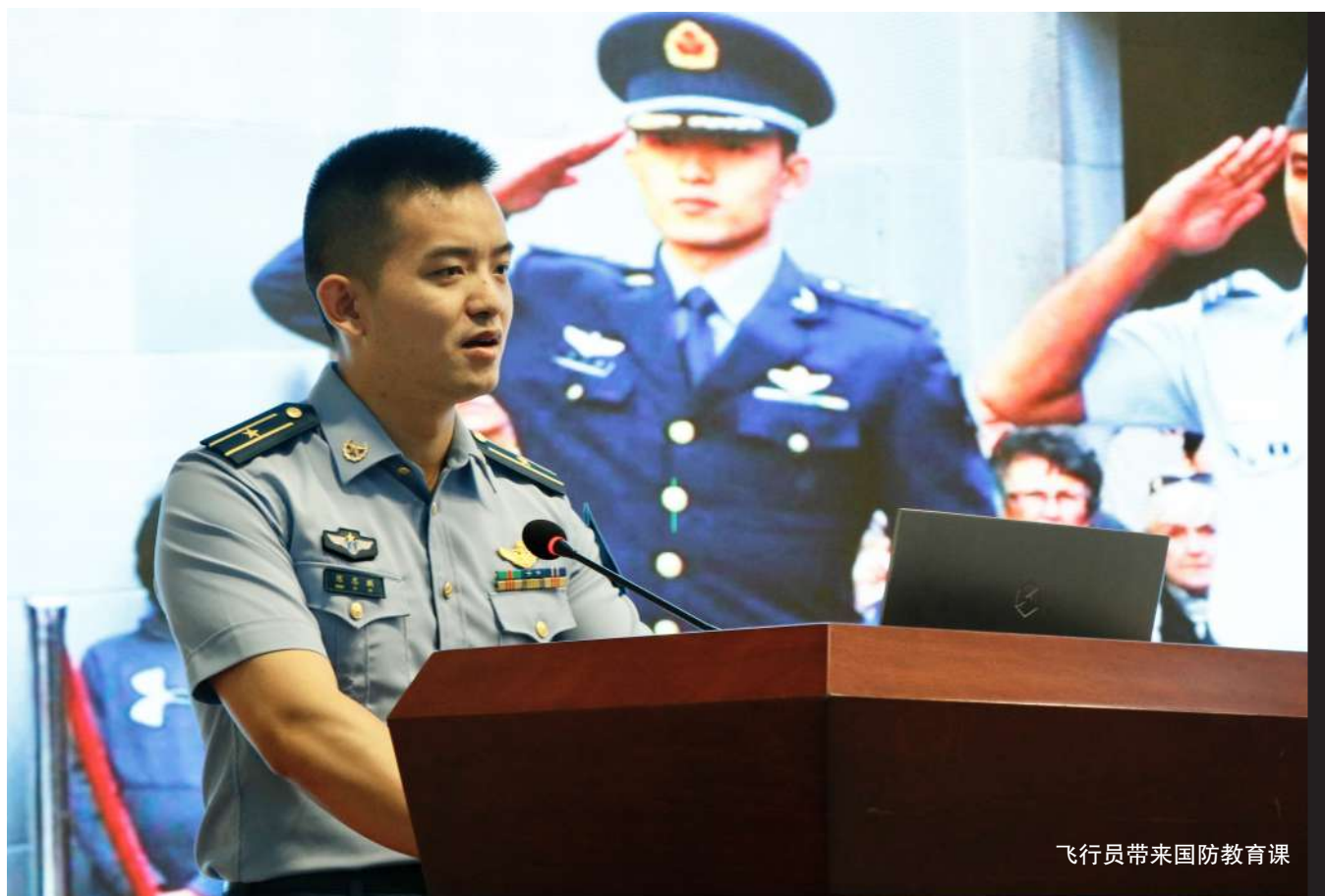
飞行员带来国防教育课

9月1日上午,由中共成都市委宣传部指导,成都市教育局、德阳市教育局、眉山市教体局、资阳市教体局主办,成都商报·红星新闻·成都儿童团承办的“感恩明志·逐梦复兴”2021成德眉资中小学开学第一课,在成都市5所学校同步开讲。