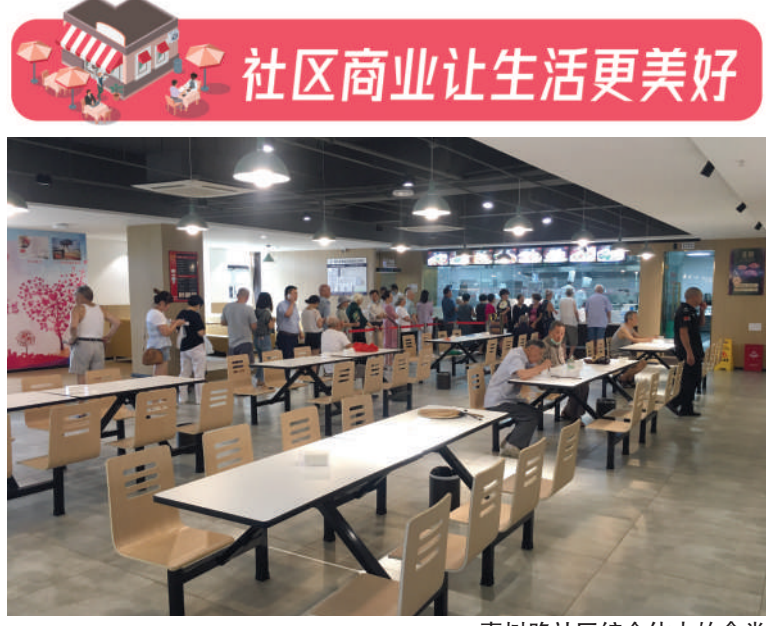
喜树路社区综合体内的食堂

以“社区商业点亮美好生活”为主题的2021中国(成都)社区商业发展大会，即将在四川天府新区麓湖公园社区举行。社区商业如何点亮美好生活?成都商报-红星新闻记者走进社区进行了探访。每到暑假，孩子往哪送是不多家长头疼的问题。这个社区的家长很轻松，因为社区服务中心楼上就是托管机构。子女上班，老年人独自在家，能不能吃得好总是让人牵挂。这个社区的老人很幸福，因为社区服务中心旁边不光有老年大学，还有社区食堂。这个社区就是成都市锦江区喜树路社区。而能解决上述问题是因为，该社区有一个和商业综合体类似的社区综合体。近日，记者前往现场一探究竟。