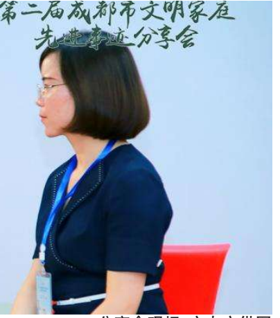
分享会现场