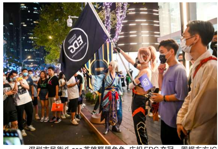
深圳市民街头cos英雄联盟角色,庆祝EDG夺冠

伽马数据发布的《2021年10月手机游戏报告》显示,2021年10月,中国移动游戏市场实际销售收入186.38亿元,环比增长3.37%,同比增0.48%。报告也提到,新游戏《英雄联盟手游》表现引起各方关注,2021年10月,首月流水TOP5新游戏中,《英雄联盟手游》占据榜首,至今在iOS畅销榜上保持在TOP10以内,月流水或超11亿。