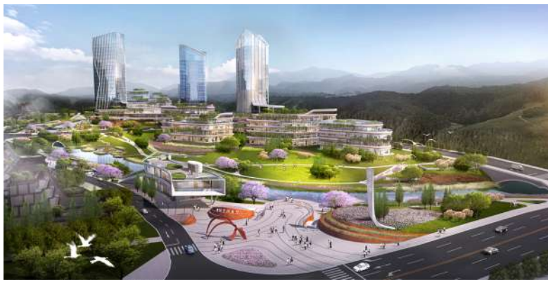
淮州湾高品质科创空间一期项目效果图

针对入驻企业发展,将通过搭建政企服务机制,为企业提供“一站式”政务服务、金融服务、人才服务等。