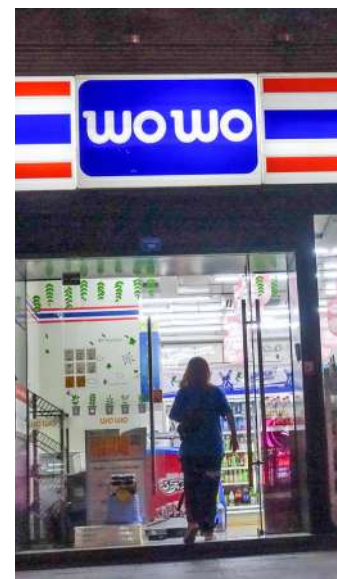
成都一家WOWO超市