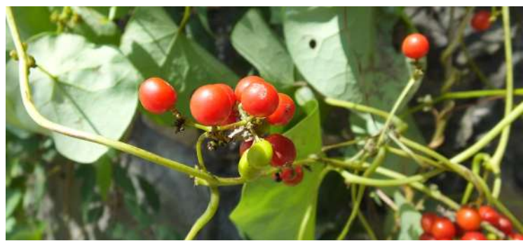
千金藤的根可提取千金藤素

截至5月17日收盘,生物谷(833266.BJ)收涨3.62%,报13.3元/股,自5月10日以来股价涨超70%;