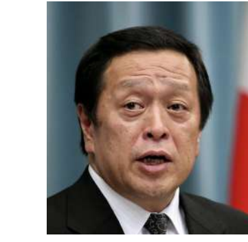
防卫大臣 浜田靖一

岸田政府计划于今年年内修订《国家安全保障战略》等三大战略性文件并图谋发展进攻性武装力量。