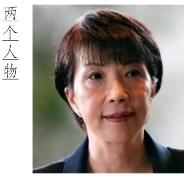
经济安保大臣 高市早苗