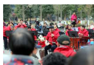
在麻石烟云广场上演奏的团队

每天下午1点半到5点左右,成都麻石烟云广场上都有数十露天KTV团队PK斗唱,歌曲通过扩音器传到不足500米开外的保利康桥小区,让人坐立难安。斗唱扰民的情况持续了将近一年,演出却愈演愈烈(成都商报报道)。