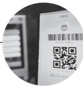
顾客通过盒马APP下单