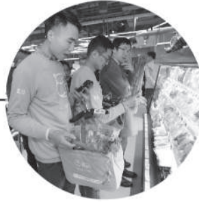
线上下单3分钟后由每个区域的人工完成分拣