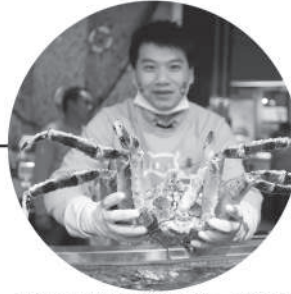
精确规划配送路线，按时送至顾客手中