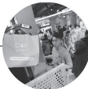
再通过悬挂链传输入库打包，整个环节控制在10分钟内