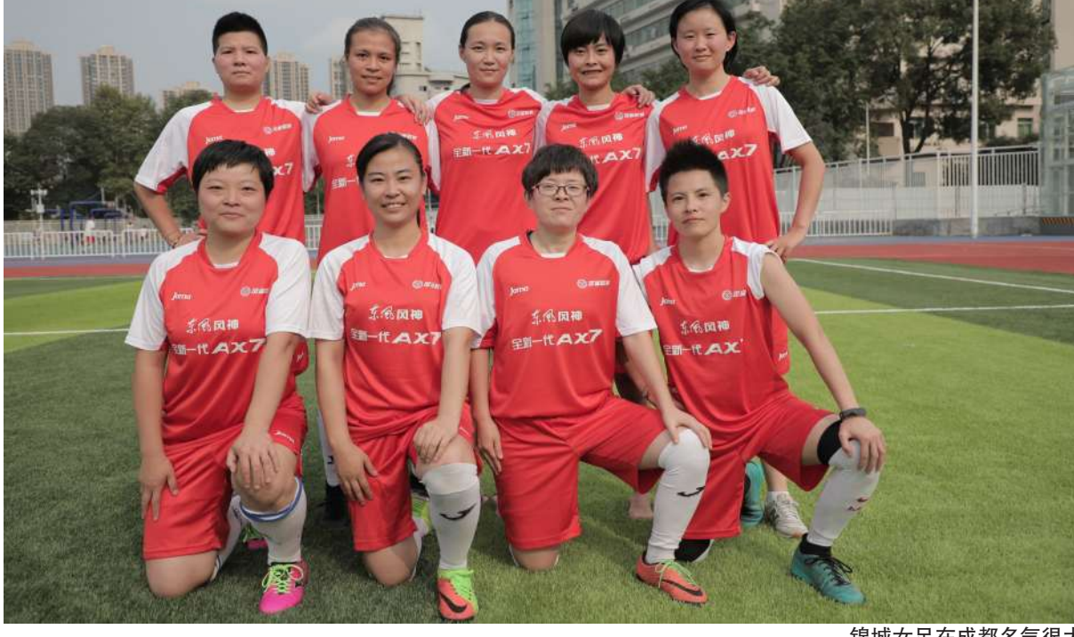
锦城女足在成都有名气很大

2018足金联赛(五人制)的成都分站赛场上，并没有单独设置女子组，只能和男队一起踢，除了在第一场比赛时多上了一名球员外，再无其他优待。之所以出现文章开头的一幕，锦城女足竟战胜蓉乐FC队进入了8强。此外，锦城女足还获得第十三届全运会五人制女子足球社会组八强、省运会群众比赛五人制足球的第二名的惊人战绩。成都商报·红星新闻记者近日联系上这则由淘宝卖家、医生、石油工程师、公司职员组成的业余女子足球队，听她们讲述了背后的故事。