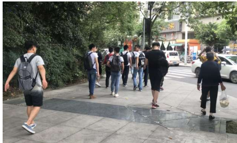
小王等人前往派出所报案