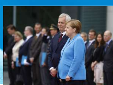
7月10日,默克尔在总理府迎接来访的芬兰总理林内时