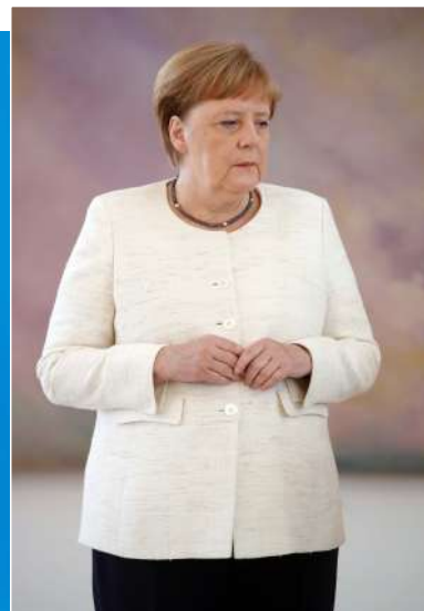
6月27日,默克尔在总统府出席新任司法部长任命仪式时