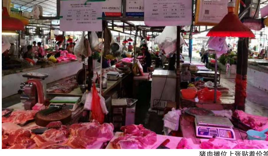
猪肉摊位上张贴着价签

成都商报-红星新闻记者从南宁市农业农村局获悉,此次实施猪肉价格临时干预措施,旨在抑制猪肉价格过快上涨势头,保障人民群众基本生活。平价猪肉的供应量是根据南宁市前期市场需求量平均水平确定的。每个定点摊位供应1头猪,供应量较为充足。南宁市每天都会监测淡村、北湖、麻村等多个主要市场的猪肉销售价格,多部门测算,得出前10日的市场均价。各市场最高限价标准根据“低于市场均价10%以上”的原则,考虑精瘦肉、五花肉、后腿肉、排骨在边猪中所占比重后确定,每10日核定调整一次。