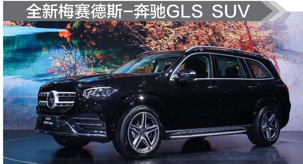
全新梅赛德斯-奔驰GLS SUV

内饰设计采用了与新A8等车型相似的数字化虚拟座舱设计，12.3英寸全液晶仪表盘搭配上(10.1英寸)下(8.6英寸)两块中控触摸屏，看上去极富科技感。