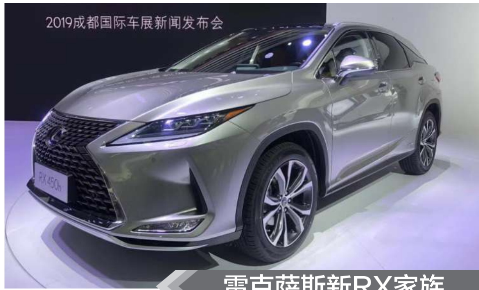
2019成都国际车展新闻发布会

创新搭载5屏联动人机互动。其中，高清超广角流媒体内后视镜，提供50°的超广角后视野；第二代高清全彩抬头显示系统，尺寸更大、画面更清晰，直接投射卫星导航、当前车速和来电显示等关键信息。