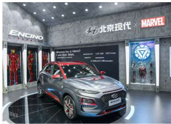
北京现代昂希诺 钢铁侠版

9月5日，北京现代限量版酷跑SUV昂希诺钢铁侠版亮相成都车展。作为全球首款以漫威英雄角色为主题设计的量产车，其车身采用双色调设计，配有钢铁侠红色和哑光灰色饰面，多处细节加入IRONMAN及MARVEL字样，重新设计的车身前部酷似面具。车内采用红黑双色装饰，液晶仪表盘融入钢铁侠头盔启动效果。 昂希诺钢铁侠版拥有的智慧内核，智能网联移动多媒体互动系统带来出众的人机交互体验；1.6L涡轮增压发动机+7速双离合变速箱，最大功率可达176匹马力。 据了解，昂希诺钢铁侠版全球限量7000台，2019年在中国市场投放999台。 在2019 ChinaJoy的天猫无限派对中还开展了线上线下相结合的直播活动。9月19日，北京现代将与阿里巴巴全面合作，通过淘宝众筹平台“造点新货，以499元的预定金，发起为期9天、限量499台的昂希诺钢铁侠版众筹活动。 除了昂希诺钢铁侠版，昂希诺纯电动、新一代悦纳、新一代ix25、第十代索纳塔等新品也在本次车展登场。