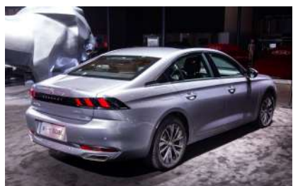
东风标致 508L 银翼灰

9月5日东风标致携10款重磅车型登陆2019成都国际车展,整个展台可谓“新”光熠熠。4008 BLACKPACK黑曜版、4008 PHEV 4WD、508L银翼灰首次亮相,508L PHEV、5008、4008 GT等核心车型蓄势待发,向人们展现了其新能源战略构架以及致力于打造Unboring The Future(“趣”享未来)的品牌体验。首次开辟的新能源专区,也让成都市民首次见识了东风标致的新能源领域规划蓝图。