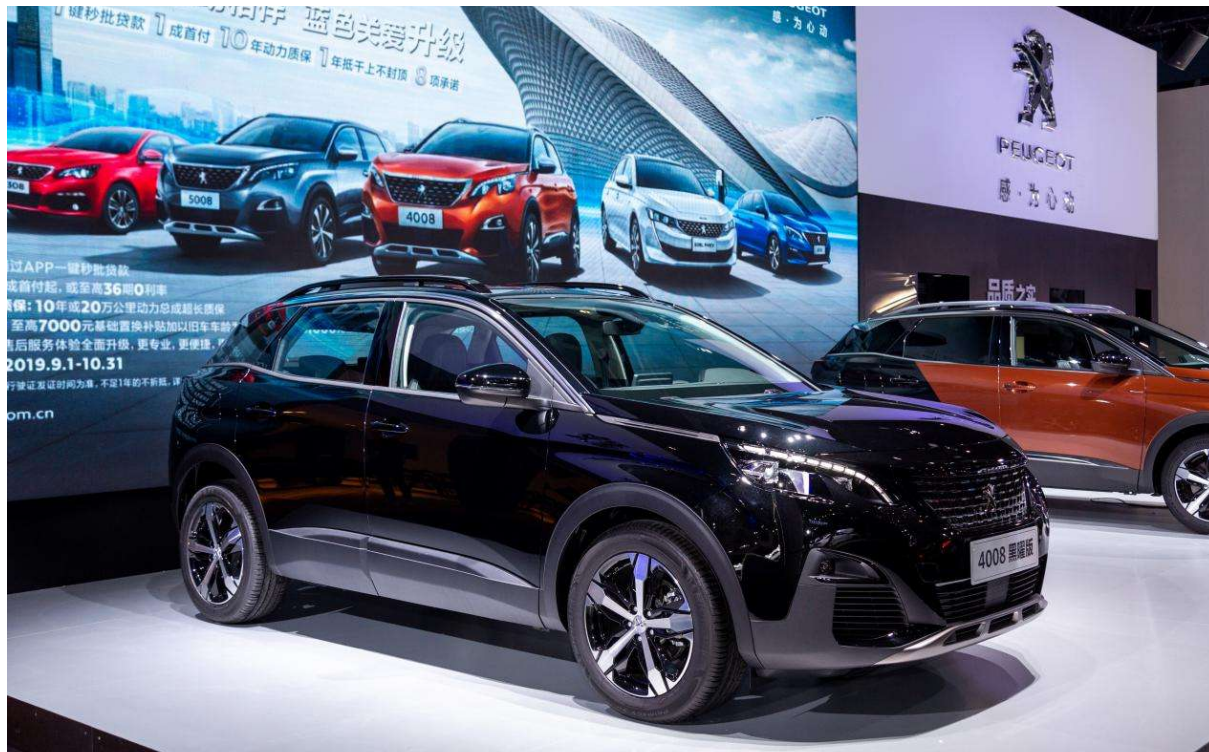
东风标致 4008 黑曜版

9月5日东风标致携10款重磅车型登陆2019成都国际车展,整个展台可谓“新”光熠熠。4008 BLACKPACK黑曜版、4008 PHEV 4WD、508L银翼灰首次亮相,508L PHEV、5008、4008 GT等核心车型蓄势待发,向人们展现了其新能源战略构架以及致力于打造Unboring The Future(“趣”享未来)的品牌体验。首次开辟的新能源专区,也让成都市民首次见识了东风标致的新能源领域规划蓝图。