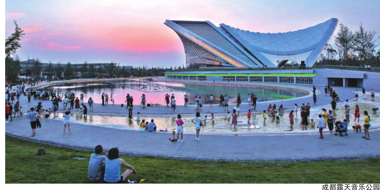
成都露天音乐公园

公园城市示范区建设把城市绿色理念、绿色生产、绿色生活方式有机联系起来，在满足新时期城市居民物质生活富足的前提下，实现居民对美好生活的向往，创造出对优质生态产品需求的城市发展新动能、新业态。