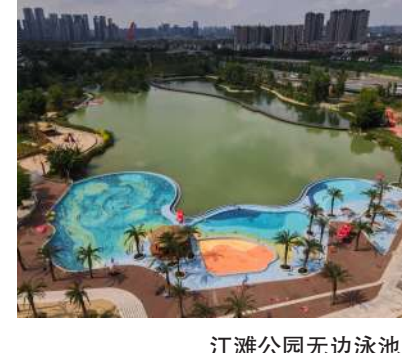
江滩公园无边泳池

公园城市建设无先例可循，一切是崭新而未知。前路崎岖，但也给新经济、新产业提供开辟山林的可能。2017年，成都确立新的城市发展战略，把发展新经济、培育新动能作为推动城市转型的战略抉择。三年时间倏然而过，成都成立新经济发展委员会，提出应用场景理论，发展思路不断创新，各项举措落到实处。