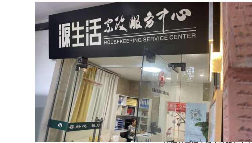
清源社区源生活家政服务中心